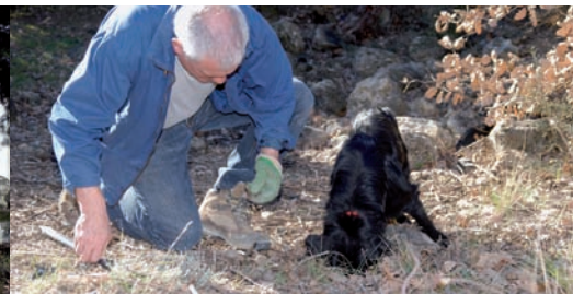
Démonstration de cavage lors de la balade en scène « La truffe, diamant noir du Comtat »