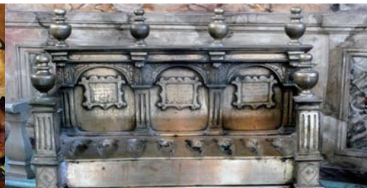
La lampe de Hannouka de la synagogue de Carpentras

Les salons baroques du Palais de Justice de Carpentras Visite-conférence le lundi 19 décembre 2011 à 14h30