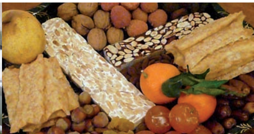
Les 13 desserts de la table de Noël