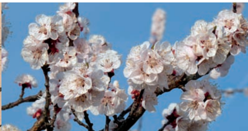
Fleurs d'amandiers, prémices du printemps