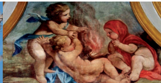
Les angelots d'hiver de la pharmacie de l'Hôtel-Dieu de Carpentras

La nature s'éveille... À la découverte des amandiers en fleurs Randonnée-patrimoine le dimanche 12 février 2012 à 14h