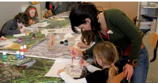
Atelier du patrimoine pour les 6-12 ans