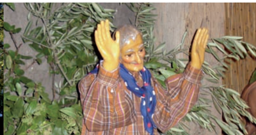
« Le ravi » de la crèche de Venasque