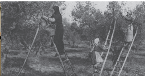
L'olivade : la cueillette des olives en Provence