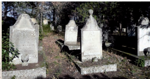
Le cimetière juif de Carpentras