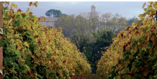
Vignes à Saint-Didier