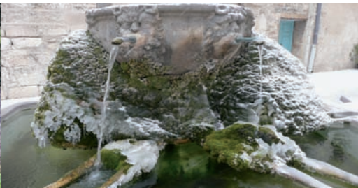
La fontaine de Saint-Didier en hiver