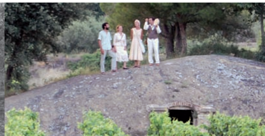
Balade en scène au cœur des vignes et des oliviers à Beaumes-de-Venise