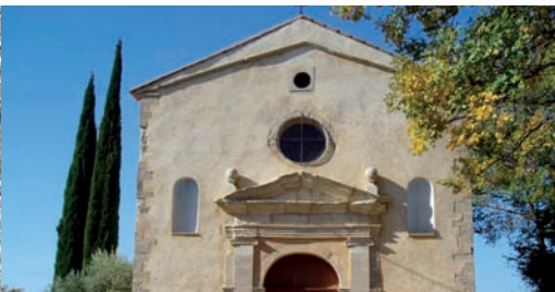
La chapelle Notre-Dame la Brune à Mazan