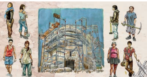
L'exposition «Têtes de pioche»